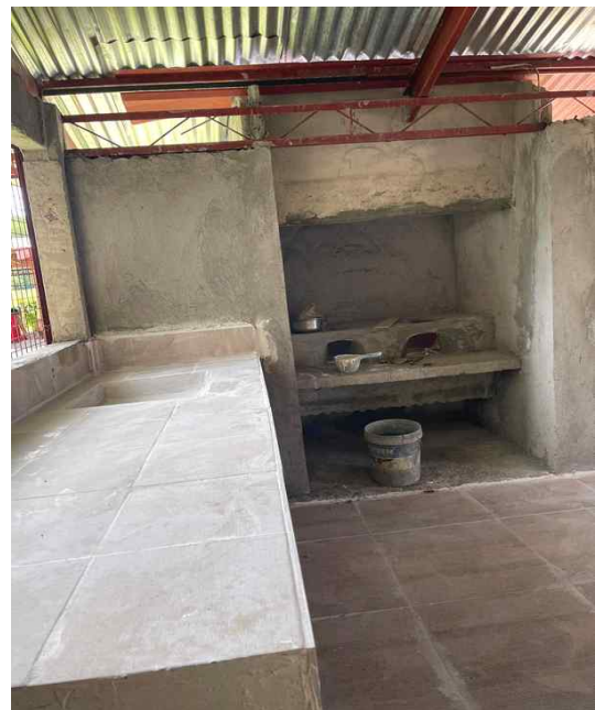
▲ 수리된 AFTC 센터 주방 내부