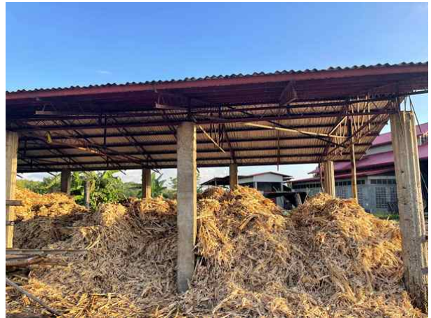
▲ 수리된 연료 저장설비