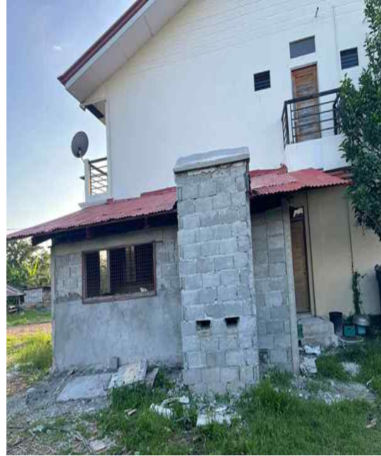
▲ 수리된 AFTC 주방 내,외부